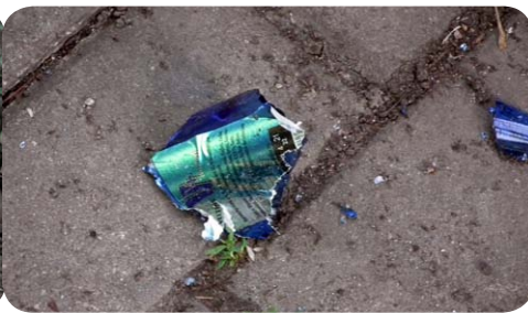
Verpackungsmüll und zerbrochene Glasflaschen finden sich zum Glück nicht an jeder Ecke

Jederzeit sind Sie als Redakteur im Print- oder Onlinebereich und/oder als Verteilungshelfer sehr herzlich bei uns willkommen!