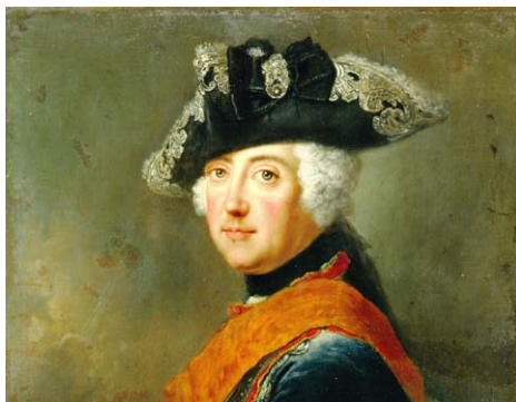
„Der Alte Fritz“ komponierte selbst

Verein gestaltet Kammerkonzerte mit selten zu hörenden Werken großer Meister und musikalischen Kostbarkeiten wenig bekannter Tonschöpfer, darunter KomponistInnen-Porträts mit Erläuterun-