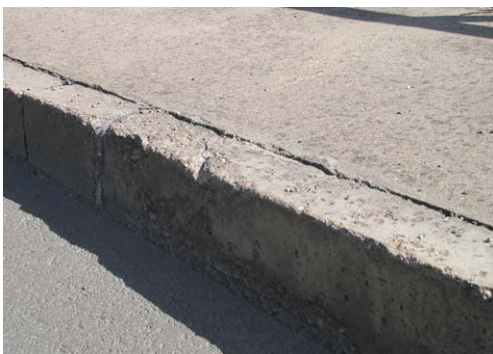
Bordsteine stellen oft große Hindernisse dar

Eine zentrale Aufgabe der nächsten Jahre wird die barrierefreie Gestaltung des Wohnumfeldes sein.