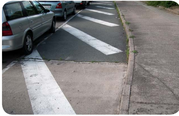
Gesperrte ehemalige Bushaltestelle in der Blücherstraße

B is vor eineinhalb Jahren konnten die Anwohner der Dornheimstraße noch bequem in der ehemaligen Bushaltestelle in der Blücherstraße parken. So standen sie mit ihren Fahrzeugen direkt am Bürgersteig und behinderten den fließenden Verkehr nicht. Auf der gegenüberliegenden Seite, am Einkaufszentrum, standen die Taxen in der Busbucht. Mit der Errichtung des prominenten Kreisverkehrs wurden diese jedoch zu Sperrflächen und das Parken in ihnen somit verboten. Laut Tiefbau- und Verkehrsamt habe die Parkgelegenheit in der alten Bushaltestelle den Anreiz geschaffen, zweireihig zu parken, was nicht erlaubt ist. Die Anwohner berichten jedoch,