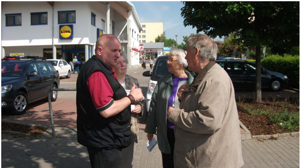
Am Infostand kommen Sie mit den Ortsteilratsmitgliedern schnell ins Gespräch

Was gefällt Ihnen am Wiesenhügel, was fehlt Ihnen? Wo kann der Ortsteilrat aktiv werden? Um Ihnen Gelegenheit zu geben, schnell und unkompliziert mit den Mitgliedern des Ortsteilrates ins Gespräch zu kommen, führen wir in regelmäßigen Abständen Infostände durch. Der erste Infostand war gut besucht, mehr als 40 BürgerInnen nutzten die Gelegenheit, an der Ecke Färberwaidweg/Am Wiesenhügel mit uns ins Gespräch zu kommen. Es ging