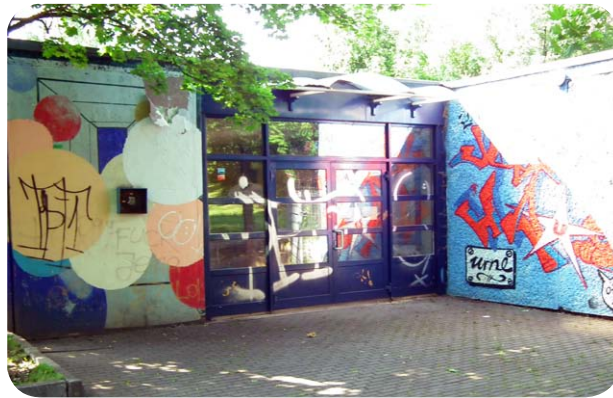
Das leerstehende ehemalige Jugendhaus „Urne“