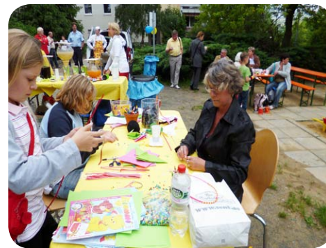
Basteln mit den Kindern

angenehm machte. Mit identischem Rahmenprogramm ging es am 21. Juni weiter, diesmal in der Dornheimstraße.