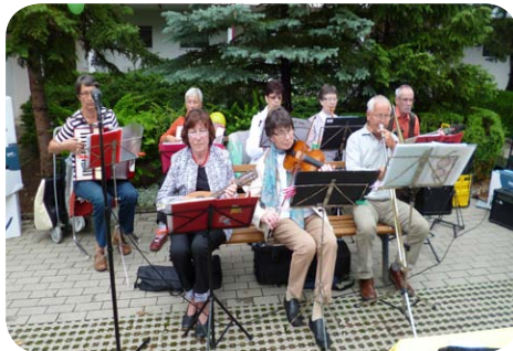
Das Seniorenorchster GutKlang

Der Ortsteilverein Soziokultur Herrenberg nutzte die Gelegenheit, um die Anwohner vor Ort über seine Arbeit zu informieren. Ein besonderer Ohrenschaus war der Auftritt des Seniorenorchesters "Gut Klang", das verschiedene Volkslieder und Evergreens spielte. Leider war der Wettergott nur wenig musikalisch und das Orchester musste an diesem Tag seine Darbietung vorzeitig beenden. Aufgrund des wiederkehrenden Regens wurde die Veranstaltung noch vor 17 Uhr aufgelöst, was sie bis dahin aber nicht weniger